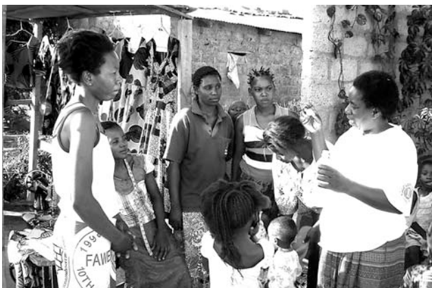
Eine Gesundheitsberaterin erklärt einer Familie die SODIS-Methode.

Solare Wasserdesinfektion - die SODIS-Methode - ist ein einfaches Verfahren zur Desinfektion von Trinkwasser. Verkeimtes Wasser wird in transparente PET- oder Glasflaschen gefüllt und während 6 Stunden an die Sonne gelegt. In dieser Zeit töten die UV-Strahlen der Sonne die Krankheitskeime ab. Die SODIS-Methode hilft, Durchfälle zu verhindern. Dies ist dringend nötig, denn Durchfall ist weltweit immer noch die zweithäufigste Todesursache bei Kindern.