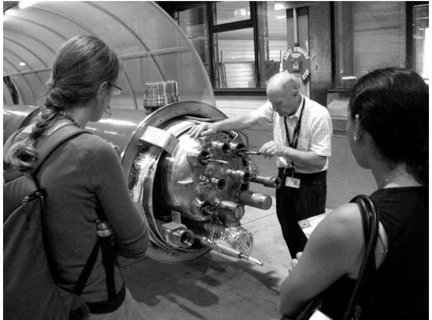
Mit grosser Leidenschaft und viel Fachwissen erklärt uns ein Physiker die technischen Details.

Das CERN hat noch weitere eindrückliche Fakten vorzuweisen: Es vereint 7000 WissenschaftlerInnen aus über 80 Ländern.