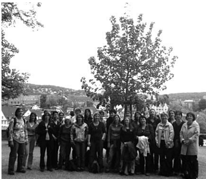
Einer der besonderen Bäume in Zürich: Die Linde, für die die Zürcher FachFrauen die Patenschaft übernommen haben.

Liebe Zürcher FachFrauen, ich danke euch für eure positive, spontane Reaktion auf die für mich nicht sehr angenehme Situation! Und die Wiederholung der Original-Führung folgt bald.