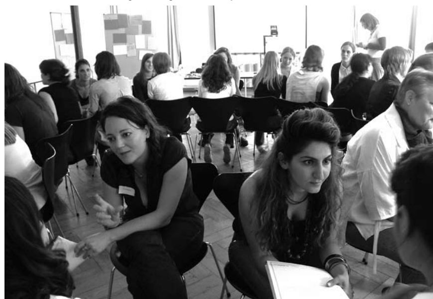
Die Mentees treffen sich regelmässig zu Workshops.