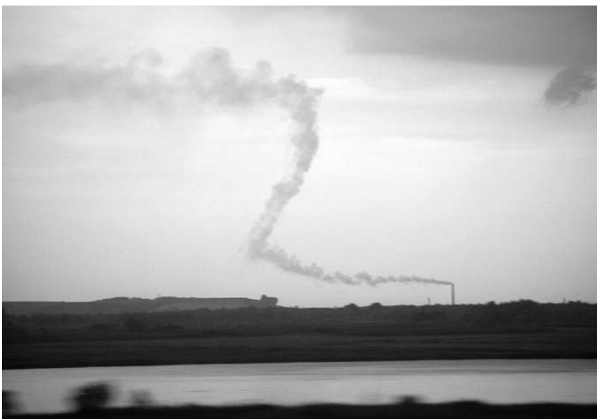
Klimawandel und Energieversorgung sind untrennbar gekoppelt: Der jüngste Anstieg der atmosphärischen CO 2 -Konzentrationen ist überwiegend auf die Verbrennung billiger Kohle in Ländern wie China (im Bild) und Indien zurückzuführen. Doch auch die Industrieländer haben ihre Hausaufgaben nicht gemacht und hinken ihren Reduktionsverpflichtungen hinterher.

Hätte man diesen Beitrag zum Wandel der Umweltsorgen vor drei Jahren geschrieben, man hätte wohl konstatiert, es sei nichts Weltbewegendes passiert seit 1989. Dann aber wurde der Klimawandel zum Quotenbringer und unverdächtige Kreise riefen das Ende des Kapitalismus aus. Zwar wurden schon in den ersten Jahren des neuen Jahrtausends Wetterextreme wie der Hitzesom-