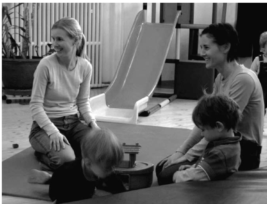
In Zürich haben die FachFrauen Gelegenheit sich auch mal mit Kind zu treffen.

meist mit grossem Rucksack draussen in der Natur anzutreffen.