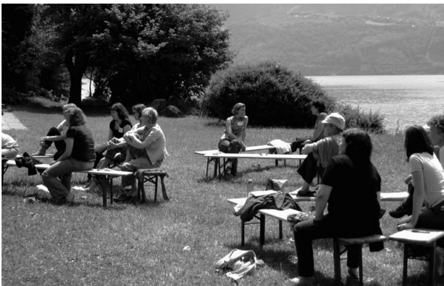
Während des Social Events am Vierwaldstättersee entwickeln die 17 anwesenden FachFrauen mit Blick auf den See und in die Berge die ersten Ideen für das Jubiläumsjahr 2009.