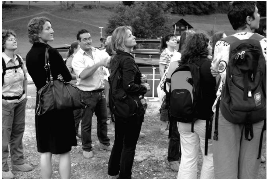
Exkursion der Regiogruppe Bern: Noch stehen nur Pilotanlagen. Doch in diesem Stadium dürfen wir, geschützt mit blauen antibakteriellen Plastikschuhüberzügen, ganz nah zu den wertvollen sibirischen Stören in Frutigen.

Im Restaurant O'Bolles in Bern trafen sich im Mai und September je rund zehn Frauen zum Mittagessen mit regem «und was machst Du?»-Austausch. Im August besuchten wir das Tropenhaus Frutigen und die angegliederte Störzucht (siehe dazu ausführlichen Artikel im Forum 4/2008). Im November packten neun Frauen die Chance das Hochsicherheitslabor in Spiez von innen zu besichtigen. Dabei erfuhren wir Interessantes zur Schweizer Sicherheitspolitik und dem Drang, unabhängig Labortests für hochriskante und unbekannte Stoffe durchführen zu können (darum der Bau des neuen