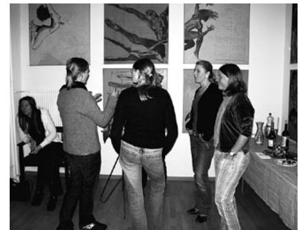
Eine kleine Bildergalerie gab den speziellen Rahmen für die beiden Neumitgliederapéros in Zürich.