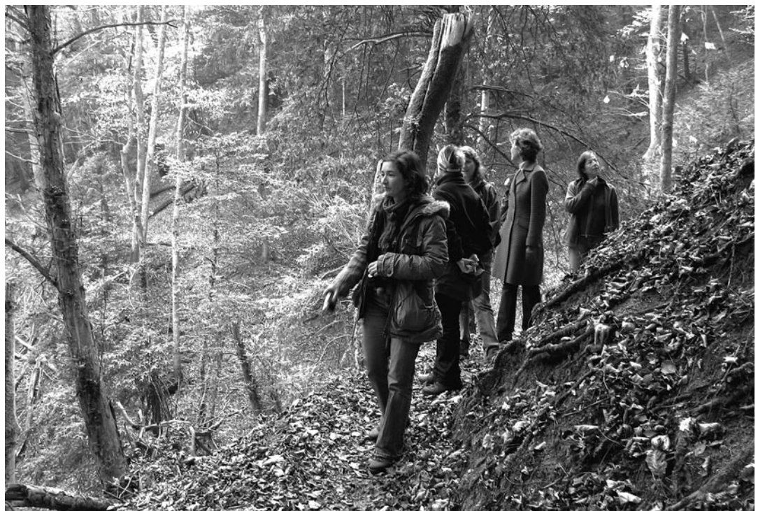
Der Sonntagspaziergang führt durch einen wahren Märchenwald.

wo schon die Herren Brown und Boveri tafelten. Der Sonntagspaziergang führt uns durch den urwaldähnlichen Eibenwald und zieht uns sofort in seinen Bann: Eng an die Hänge geschmiegt, stehen und liegen die uralten Eiben. Nach zwei Stunden erreichen wir das Gebestorfer Horn, hoch über dem Zusammenfluss von Aare, Reuss und Limmat. Gute Gespräche im zauberhaften Herbstwald – Sonntagsgenuss pur! ○