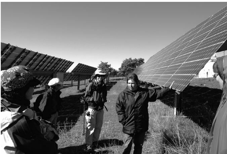
Jura-Erlebnistour: Zwischen Wind- und Sonnenenergie am Mont Soleil und Mont Croisin.

Zuerst verhinderte ein Streik das Unterfangen, später klappte es dennoch: 35 FachFrauen besichtigen die NEAT-Baustelle, wo in den nächsten 10 Jahren das Gotthard-Massiv durchbohrt wird. Dann kann man hier die 57 km des längsten Eisenbahntunnels der Welt in nur 18 Minuten durchmessen. Für die Führung reisten die Frauen indes Stunden an! Nach einem NEAT-Vortrag im Informationszentrum Biasca kleideten wir uns in Overalls, Helm und Stiefel. Per Autobus ging's zur Multifunktionsstelle Faido, die Rampe runter tief in den Berg, wo es das ganze Jahr warm, feucht und staubig ist. Wir bestaunten die Tunnelröhren, welche teilweise bereits zementiert und beleuchtet sind. Weiter vorne frass sich die Tunnelbohrmaschine langsam durchs Gestein, für uns unsichtbar und still. Einen kleinen Augenblick des geschichtsträchtigen NEAT-Projekts mitzuerleben, das war ein Erlebnis!