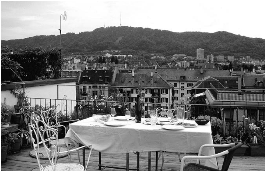
Nach der Letzibadi trafen sich die Planerinnen auf der Dachterasse des Wohnprojekts Karthago zum Nachtessen mit Panoramansicht über Zürich.

2007 trafen sich interessierte FachFrauen und Zugewandte an vier Abenden zu einer Führung mit fachlichen Inputs und einem anschliessenden Vernetzungsteil mit Nachtessen. Alle Veranstaltungen waren gut besucht und boten ein vielfältiges Programm. Gudrun Hoppe