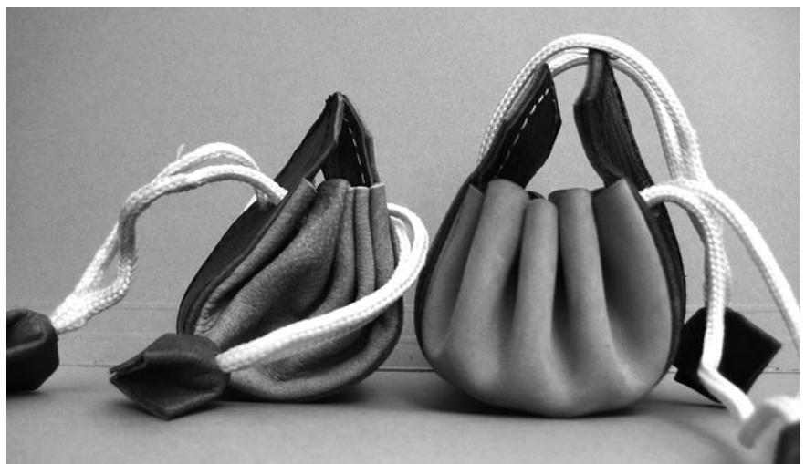
Die Lohnbeutel von Frauen und Männer sind auch im Umweltbereich ungleich.

Die FachFrauen Umwelt (FFU) – das Schweizer Netzwerk von Berufsfrauen im Umweltbereich – befragte zusammen mit dem Schweizerischen Verband der Umweltfachleute (svu-asep) 270 in der Umweltbranche tätige Mitglieder zu Salär und Anstellungsverhältnis. Der Tatsache, dass Frauen in der Schweiz im Durchschnitt fast 20 Prozent weniger verdienen als Männer, wollten die FFU auf den Grund gehen. Die Ergebnisse sind ernüchternd: Mehr als 80 Prozent der Umweltfachleute haben einen akademischen Abschluss in der Tasche und dennoch erzielen Männer im Schnitt einen monatlichen Bruttolohn von 8 464 Franken, Frauen bloss einen von 7 520 Franken.