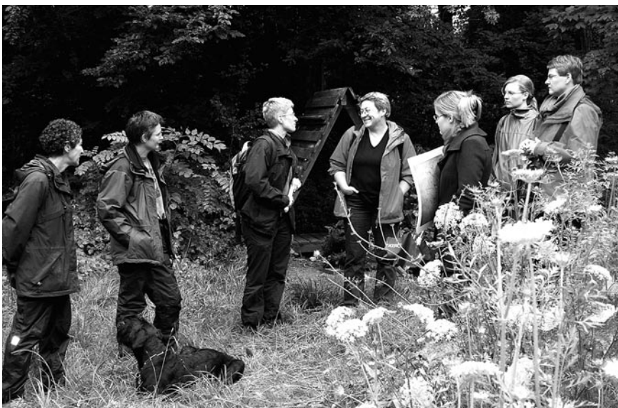
Die FachFrauen der Regionalgruppe Jurasüdfuss auf Exkursion im Wengisteinpark.

Am 26. September 2007 besuchten wir die Sonderausstellung «Pilze» im Naturhistorischen Museum Olten und bewunderten anschliessend die reichhaltige permanente Ausstellung.