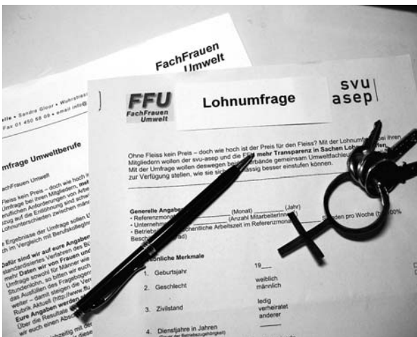
Fragebogen: Uns interessieren an der Lohnumfrage speziell Aspekte einer möglichen Lohndiskriminierung.

Die Daten werden momentan ausgewertet und analysiert. Wir wollen unter anderem herausfinden, welche Variablen den Lohn beeinflussen, damit wir anhand eines Modells Löhne prognostizieren können. Natürlich interessiert uns besonders, welchen Einfluss das Geschlecht auf die Lohnhöhe hat. Da wir nicht nur eine deskriptive Statistik erstellen wollen, sondern auch vertiefte statistische Analyse- und Testverfahren zur Anwendung kommen, dauert die Auswertung noch an. Unser Ziel ist es, im Laufe des Jahres 2007 über die Resultate der Lohnumfrage zu informieren.