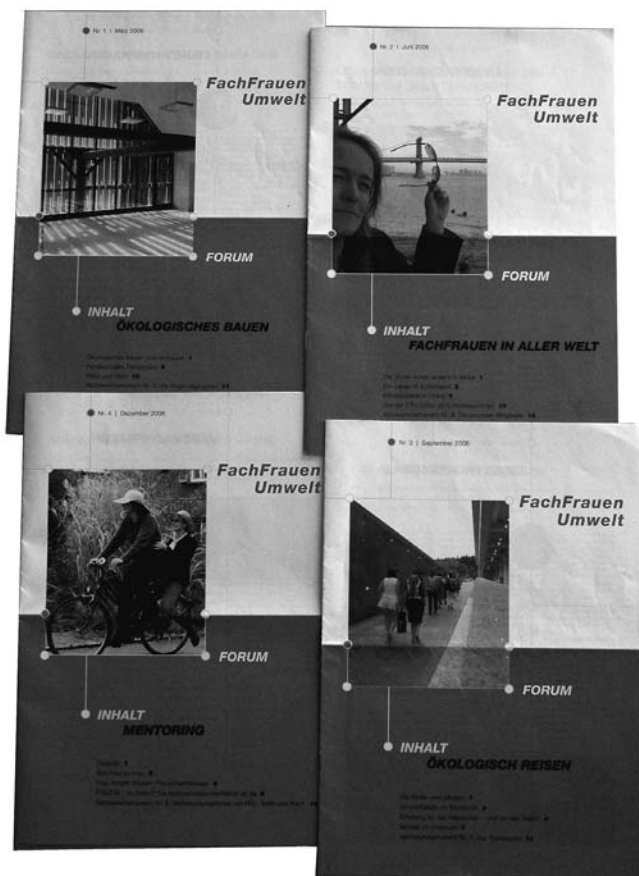
Viermal informierte das FORUM 2006 über spannende Themen aus dem Bereich Frau und Umwelt.