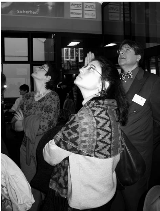
Als Einstieg liessen sich die FachFrauen unter dem Titel «Global Skin» neuste Techniken des Fassadenbaus erklären.

Als erster Event stand am 27. Januar die SwissBau 2007 in Basel. Diese Messe bot einen Überblick über die Zukunft der Bauwirtschaft. In einer gezielten Führung durch die Messehallen wurden den Teilnehmerinnen Eindrücke über energiesparendes Bauen, sowie dessen Möglichkeiten und Grenzen aufgezeigt. ○