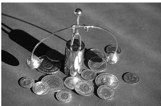
Die FFU-Rechnung 2006 schliesst ausgeglichen.