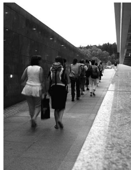
Das erste Planerinnentreffen führte durch die ETH Hönggerberg und das Projekt Science City.

Bisher fanden alle Treffen im Grossraum Zürich statt. Eingeladen sind alle an Planung interessierten Frauen. ○