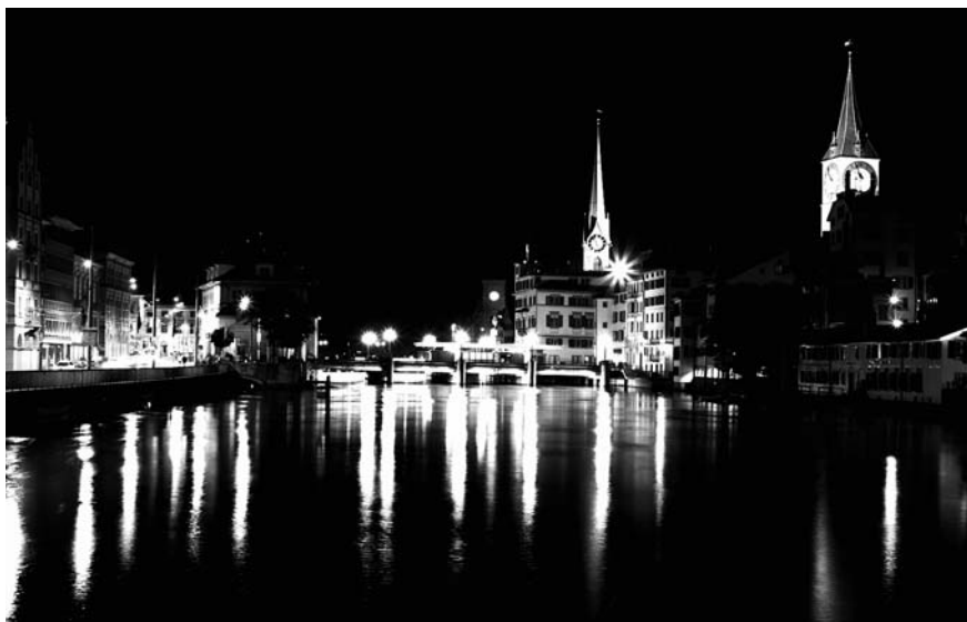
Wieviel Licht in der Nacht darf es sein? Führung durch Zürich zum Thema Lichtemissionen – Lichtverschmutzung.