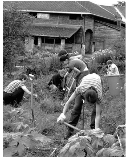
Noch ist der alte Garten ein Stück Wiese.

Im Laufe des Sommers 2007 ist ein Ausflug auf den Mont Soleil geplant, bei dem wir «unseren» Garten besichtigen werden. Gleichzeitig soll eine Führung durch das nahe gelegene Windkraftwerk Einblicke in die nachhaltige Energiegewinnung bieten. Informationen dazu werden demnächst folgen. ○