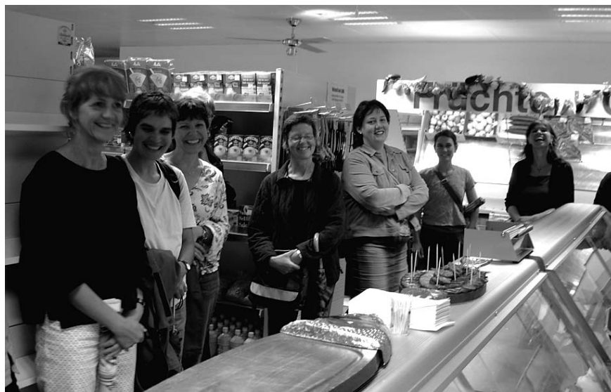
16 Zentralschweizer FachFrauen auf Streifzug durch das multikulturelle Luzerner BaBeL-Quartier.

Die Zusammensetzung unserer Gruppe ist seit längerem mit elf Frauen stabil. Wir treffen uns in ungefähr monatlichen Abständen, in der Regel bei einem Mitglied unserer Diskussionsgruppe. Wenn alle an unseren Abenden teilnehmen können oder wenn im Dezember sogar noch langjährige frühere Mitglieder zu uns stossen, wird es in den Stuben der Gastgeberinnen jeweils eng. Zuerst tauschen wir beim Essen Neuigkeiten aus, der zweite Teil des Abends ist der Diskussion unserer Lektüre gewidmet.