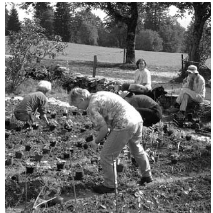
Als Belohnung nach all dem Jäten: das Pflanzen der Stauden.