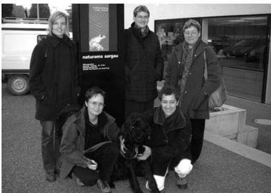
Die Regionalgruppe Jurasüdfuss zu Besuch in der Sonderausstellung «Schatzkammer Tropen» im Naturama in Aarau.