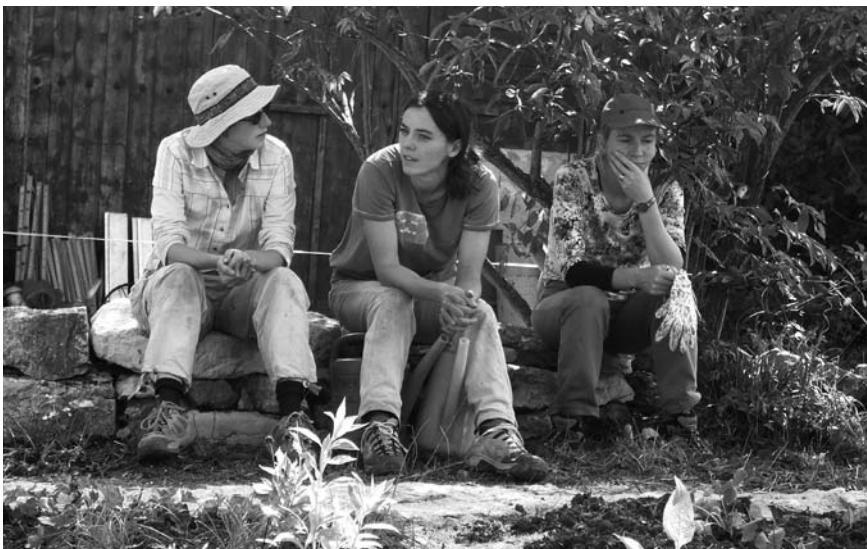
Teilnehmerinnen am Sonntag nach getaner Arbeit: müde, aber sehr zufrieden.